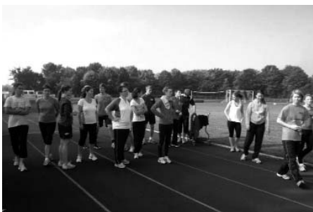
Die Teilnehmer des C-Trainer-Lehrgangs.

Abends, nach dem Abendessen, saßen wir meistens mit den anderen Teilnehmern und Teilnehmerinnen vom Lehrgang zusammen und haben uns unterhalten, Karten gespielt oder uns noch einmal beim Fußballspielen ausgediebt. Bei all diesen Aktivitäten hatten wir sehr viel Spaß. Am Mittwoch durften wir dann auch das Schwimmbad besuchen, das mit Dampfbad, Sauna und Whirlpool sehr gut ausgestattet war. Am Ende der Lehrgangswoche fiel es allen Teilnehmern und Teilnehmerinnen schwer – natürlich auch uns – sich von den anderen zu verabschieden, da wir eine super lustige und auch lehrreiche Woche hinter uns hatten.