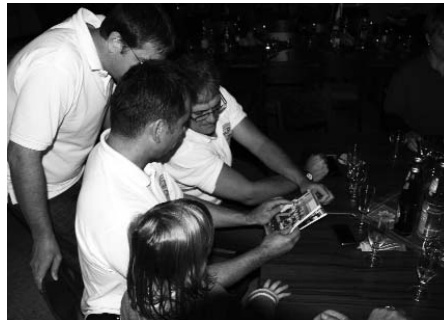
Erste Blicke ins Jubiläumsbuch.

Und dann konnte auch Nandy mit einem Geschenk aufwarten: passend als Ergänzung (und nicht, wie er betonte, weil sie in Ungarn nicht lesen und