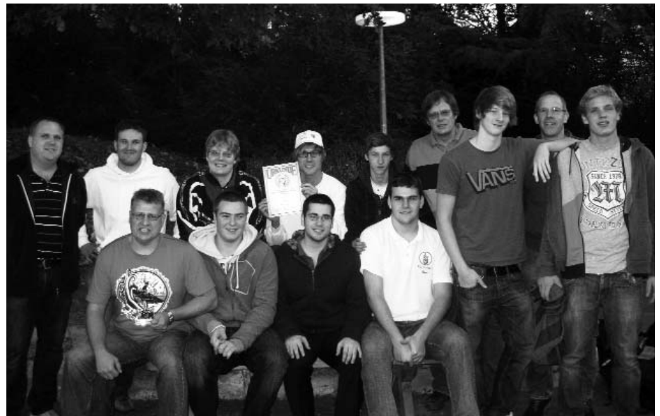
Sieger beim VfVS Turnier 2011.