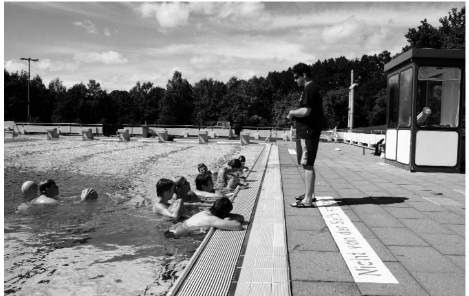
Der Cheftrainer gibt Anweisungen.