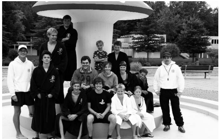
Die Teilnehmer des Trainingslagers 2011.

Mit einem Trainingsspiel wollten wir nun unsere Taktik aufbessern. Nach einer gelungenen Partie ging es dann mit dem Abendessen weiter. Bevor wir uns auf unser Zimmer zurückzogen, haben wir uns doch noch die Bilder von den ersten zwei Tagen und einige