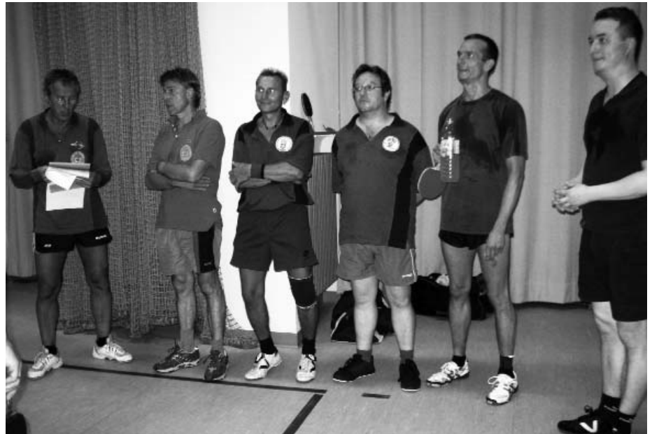
Die Mannschaftsaufstellung für die Spielsaison 2011 / 2012:

Herzlichen Glückwunsch an die Sieger und Platzierten, somit an das Organisationsteam für die reibungslose Durchführung.