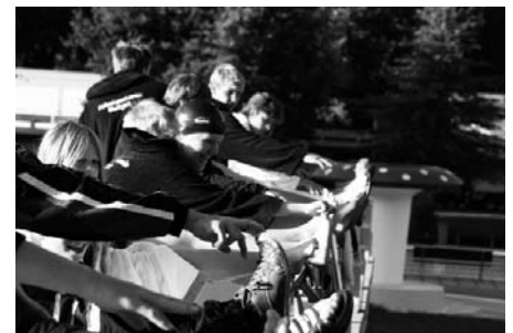
Dehnen vor dem Training.

Am Freitag, nach dem Schwimmtraining, haben wir angefangen unser Zeug zusammen zu suchen und zu packen. Nun konnte angefangen werden aufzuräumen und zu putzen. Die Aufteilung, wer was macht, war schnell geklärt. Jeder hat etwas zu tun gehabt, und mitgeholfen.